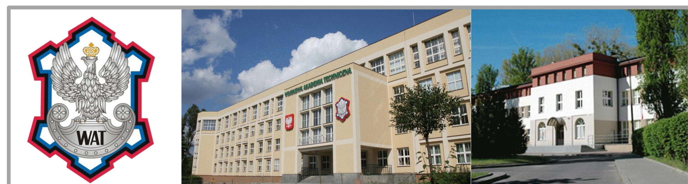
Military University of Technology