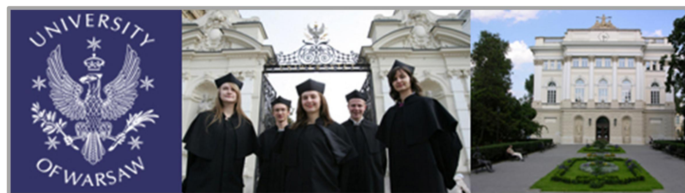
University of Warsaw